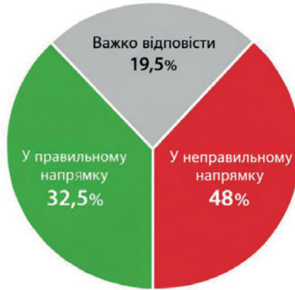
Рис. 3. Оцінка напрямку розвитку України (2025) (Разумков Центр, 2025)

За кордоном під час пандемії COVID-19 аналогічна закономірність спостерігалася у Німеччині та Італії, де рівень довіри до державних інституцій визначав ефективність дотримання обмежувальних заходів (European Social Survey, n.d.).