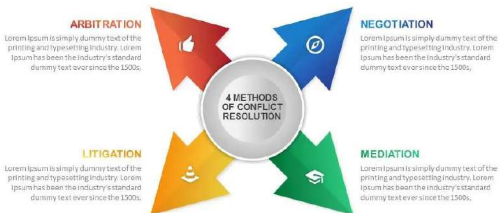
Рис.1. Методи вирішення конфліктів (Lande, 2000, p. 324).

Саме тому політичний конфлікт можна вирішити різними методами, включаючи переговори, медіацію, арбітраж й судовий розгляд (рис.1).