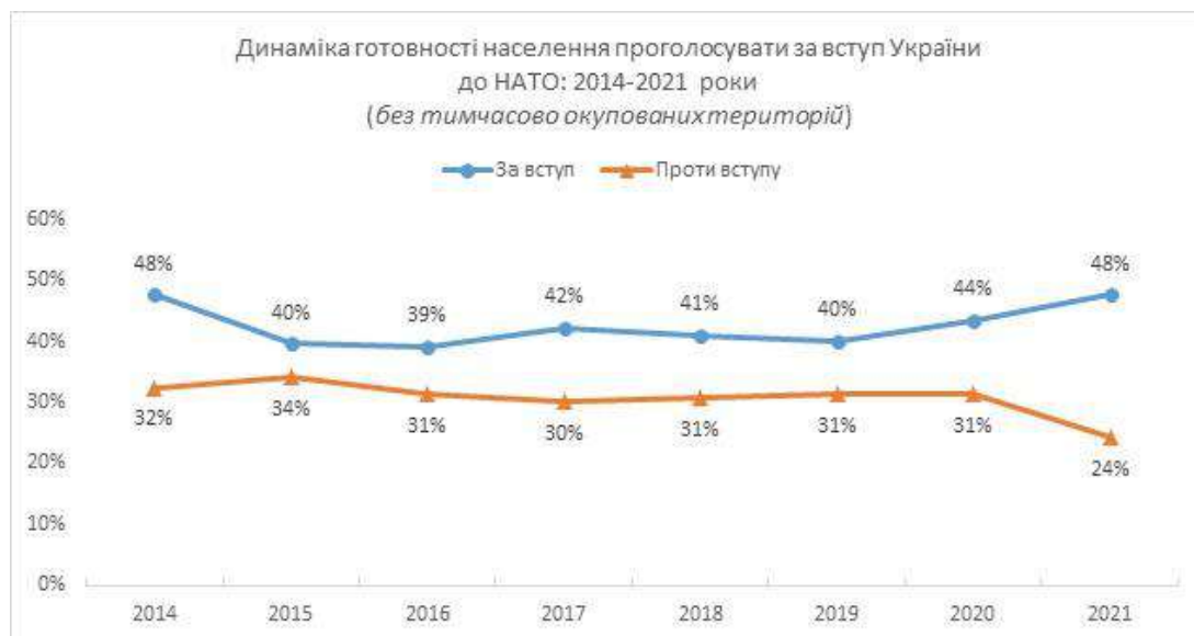
Рис. 1. Динаміка готовності населення проголосувати за вступ України до НАТО 2014–2021 (КМІС, 2021)

На запитання щодо участі в голосуванні на загальнонаціональному референдумі щодо вступу в НАТО, станом на 2021 р. готові віддати свої голоси збільшилась до 48 %, коли ще у 2019 р. таких налічувалось лише 40 % (рис. 1).