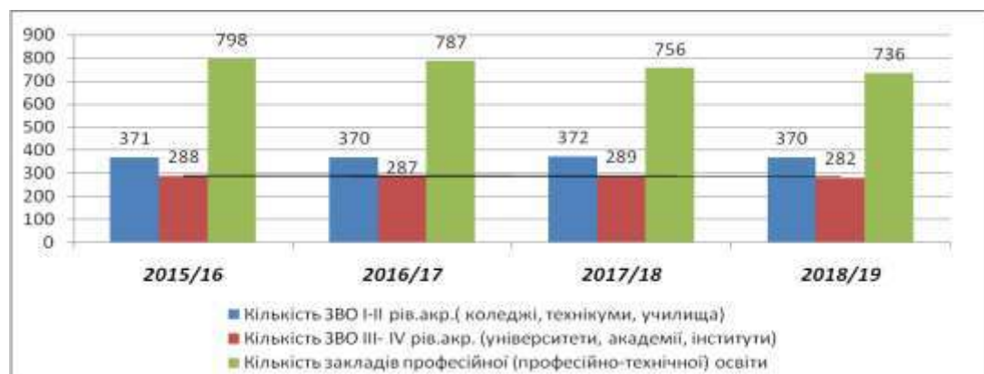
Рис. 1. Динаміка змін професійно-освітніх закладів