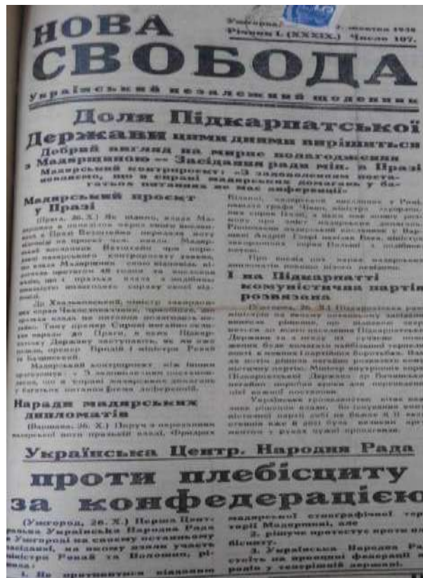
Рис. 1. Титульна сторінка «Нової свободи за 27 жовтня 1938 р.

На підтвердження цього публічно надавали докази визначення національної ідентичності: «Чим певніше нові кордони будуть триматися етнографічних меж і чим менше будуть змішані національності, тим скоріше наступить спокій та мир, викликаний наслідком Версальської плутанини. Сама Німеччина, обмежуючи свої претензії корінною судецькою областю, надала доказ, що вона вважає тільки такі розв'язання тривкими» Nova svoboda, October 15, 1938, p. 2). Такі заяви, на думку проукраїнських сил, були виправдані, оскільки слов'яни не бажали приєднуватися до угорців (Ukrainske slovo, October 28, 1938, p. 1).