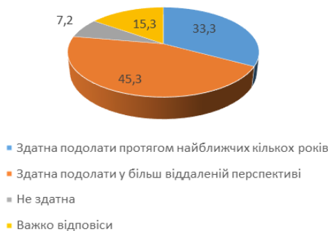
Рис. 4. Здатність України подолати існуючі труднощі