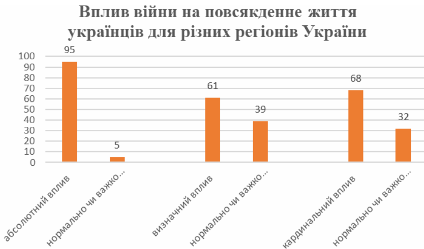
Рис. 1. Вплив війни на повсякденне життя українців

За даними соціологічного дослідження фонду «Демократичні ініціативи» ім. І. Кучеріва та соціологічної служби Центру Разумкова, яке було проведено 8–15 грудня 2023 року, українське населення відчуває вплив війни на повсякденне життя та велику надію і віру в перемогу (рис. 1) (Денькович, 2023).