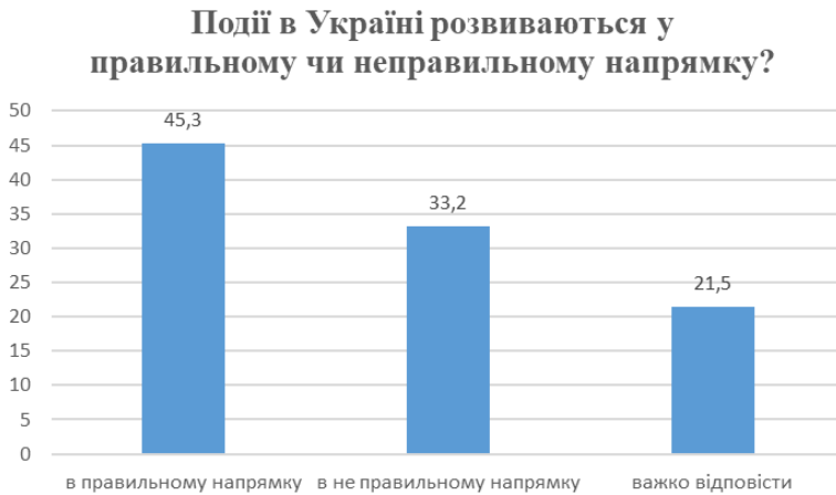
Рис. 3. Напрямок розвитку України

Після закінчення війни Україна впорається з усіма труднощами, які постають перед нею, також у післявоєнний період Україна не залишиться наодинці із проблемами відбудови та розвитку, але вся важкість упаде на плечі громадян країни, і їх це не лякає, про це свідчать дані результатів соціологічного опитування Центру Разумкова. Серед опитаних 45,3 % вказали на те, що країна подолає існуючі проблеми і створить свій власний вектор розвитку і подолання всіх критичних питань. Як бачимо, відсоток тих, хто не знає, як складеться ситуація, незначний і становить 15,3 % (рис. 4) (Разумков Центр, 2023).