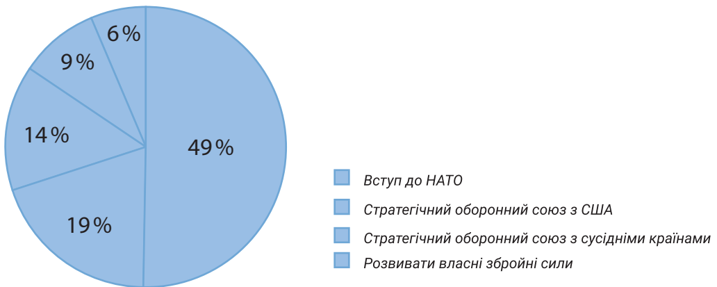
Рис. 3. Фактори гарантій національної безпеки України у російсько-українській війні (Крамар, 2023).

Як ми спостерігаємо, серед членів Європейського Союзу є країни, які підтримують росію, блокують рішення. І в багатьох питаннях про міжнародну підтримку України та виведення парадигми миру є відсутність єдиної стратегії та твердого рішення з боку міжнародної спільноти. Наступною