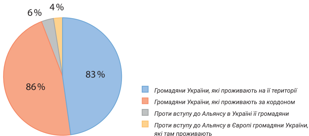
Рис. 2. Підтримка вступу в НАТО громадянами України

Виділимо аспекти, які впливають на вирішення проблем у збройному конфлікті росії проти України: