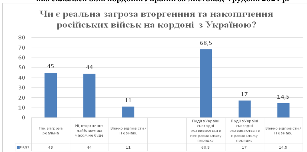
Динаміка ставлення населення України до ситуації, яка склалася біля кордонів України за листопад–грудень 2021 р.