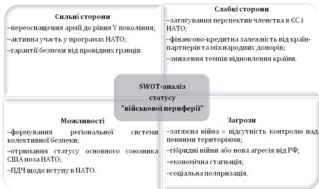
Рис. 3. Swot-аналіз статусу «військової периферії»

Але колективний Захід розглядає Україну уже не просто як «буферну зону», нейтральну територію, а як бар'єр проникнення в Європу агресії, війни та конфліктів. Країни-партнери готові платити за свою безпеку, надаючи гранти, фінансову допомогу, приймаючи українських біженців, а також інвестуючи в переоснащення Збройних сил України, щоб стримати можливе просування до їх кордонів.