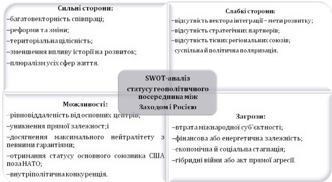
Рис. 1. Swot-аналіз статусу геополітичного посередника між Заходом та Росією

Об'єктивно Україна майже ніколи не була повністю нейтральною. Фінансова чи енергетична залежність кидала її в лоно то одного, то іншого глобальних центрів, унеможливаючи самостійне й суверенне державотворення. Найбільше занепокоєння викликає нецивілізований (ігнорування міжнародного права, порушення двосторонніх договорів, невиконання рішень міжнародних судів тощо) спосіб міжнародної співпраці РФ як з іншими країнами, так і з Україною зокрема, що ставить під сумнів прямі або неформальні домовленості про забезпечення Україні у новому світоустрої статусу геополітичного посередника між Заходом і Росією.