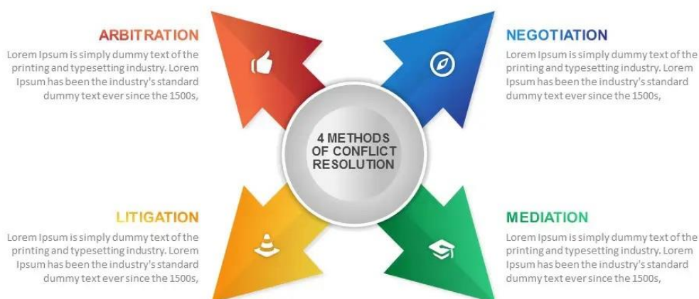
Рис.1. Методи вирішення конфліктів (Lande, 2000, р. 324).

Саме тому політичний конфлікт можна вирішити різними методами, включаючи переговори, медіацію, арбітраж й судовий розгляд (рис.1).