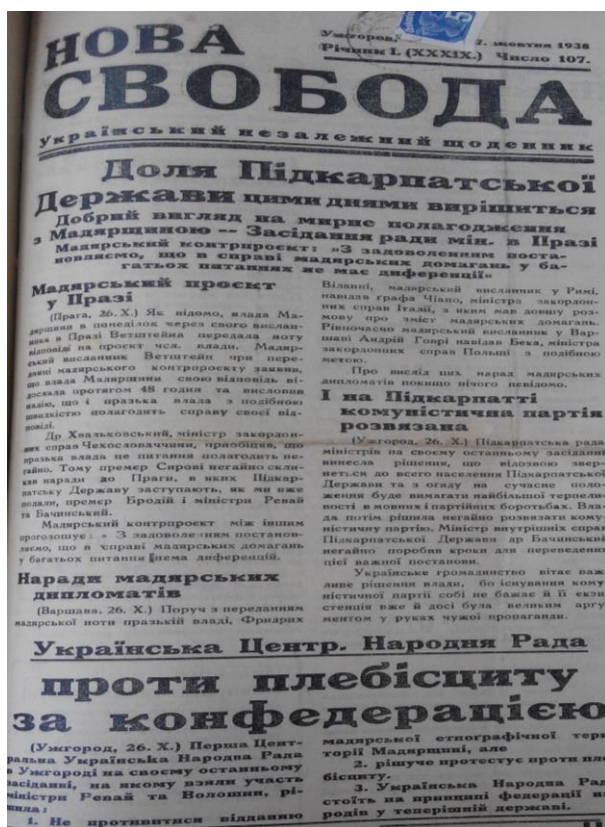
Рис. 1. Титульна сторінка «Нової свободи» за 27 жовтня 1938 р.

На підтвердження цього публічно надавали докази визначення національної ідентичності: «Чим певніше нові кордони будуть триматися етнографічних меж і чим менше будуть змішані національності, тим скоріше наступить спокій та мир, викликаний наслідком Версальської плутанини. Сама Німеччина, обмежуючи свої претензії корінною судецькою областю, надала доказ, що вона вважає тільки такі розв'язання тривкими» Nova svoboda, October 15, 1938, p. 2). Такі заяви, на думку проукраїнських сил, були виправдані, оскільки слов'яни не бажали приєднуватися до угорців (Ukrainske slovo, October 28, 1938, p. 1).